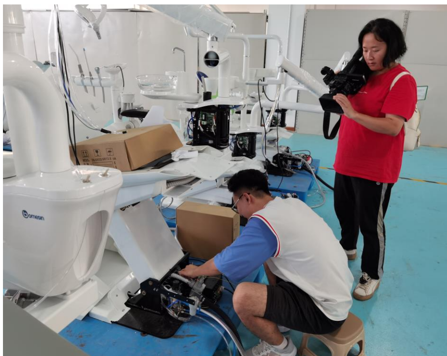
图 2 见习学生正在检查治疗椅的装配质量