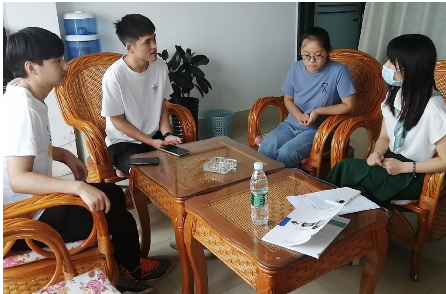
图3 学校专业教师现场了解情况