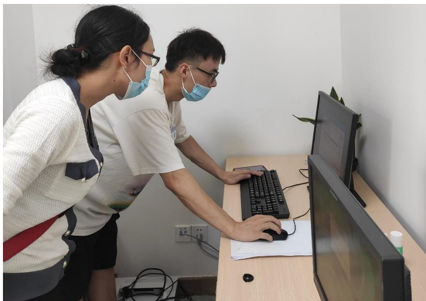
图 7 学校专业教师观摩学生的实际工作任务