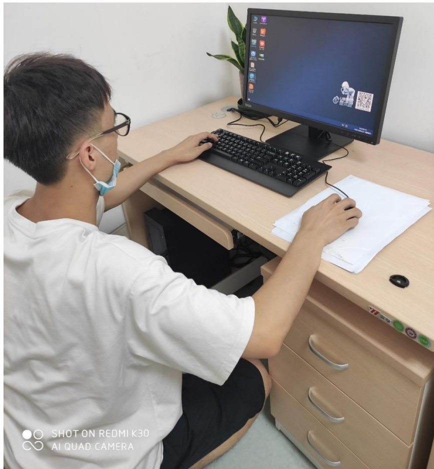
图 6 见习学生为护士站的电脑进行系统维护