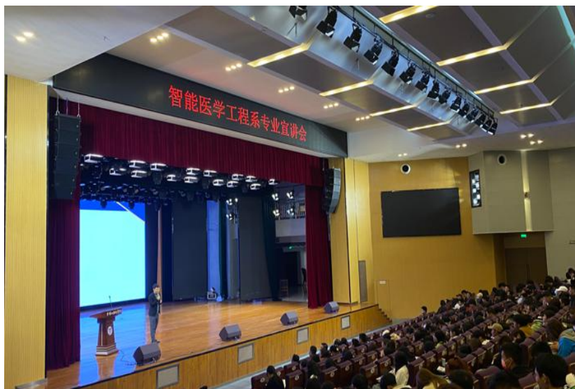
图 2 华光口腔集团电子商务部经理李彬进行演讲

四川博美星口腔设备有限公司总经理李德军做智能医疗设备技术、医疗器械维护与管理专业宣讲：介绍本专业岗位的薪酬情况、本校学生在其公司的实习培养情况，建议同学们提前做好职业规划，选好专业。